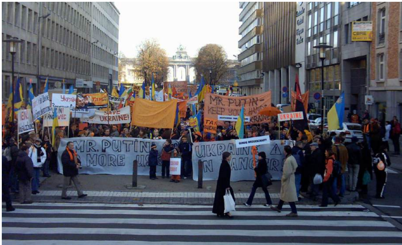
Мітинг у Брюсселі, Ukraineelectionsdemonstrationbrussels 20041128 Помаранчева революція — Вікіпедія

Як поставилася світова спільнота до Помаранчевої революції?