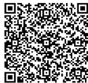
Лист стосовно надання освітнім програмам зразкової акредитації